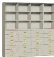
Komoda 28 + Regał 4