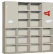
Regał 4 + Szafa 4