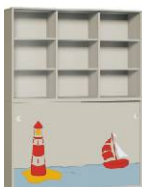
Szafa 2 + Regał 3