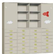
Komoda 28 + Szafa 4