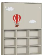
Regał 3 + Szafa 2