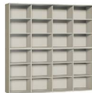
Regał 4 + Regał 4