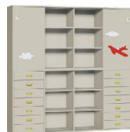
Komoda R4 + Szafa 4