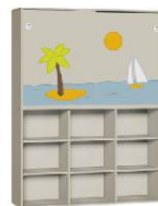
Regał 3 + Szafa 2