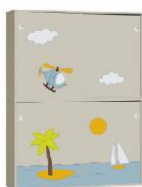
Szafa 2 + Szafa 2