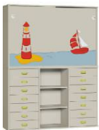
Komoda R1 + Szafa 2