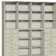
Komoda R4 + Regał 4