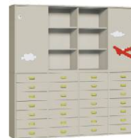
Komoda 28 + Szafa 4