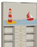
Komoda 7 + Szafa 2