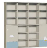
Szafa 4 + Regał 4