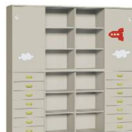
Komoda R4 + Szafa 4