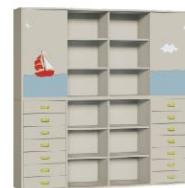
Komoda R4 + Szafa 4