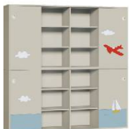
Szafa 4 + Szafa 4