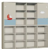
Regał 4 + Szafa 4