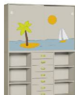
Komoda 7 + Szafa 2