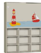
Regał 3 + Szafa 2