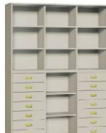
Komoda R1 + Regał 3