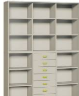
Komoda 7 + Regał 3