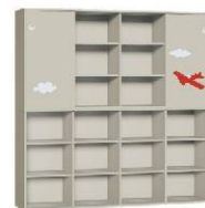
Regał 4 + Szafa 4

Wysokość całkowita zestawionych brył: 880 \times 2 = 1760 mm. Bryły są wyposażone w nóżki do regulacji w wysokości: od 15 mm do 25 mm. Zestawione bryły powinny zostać skręcone za pomocą złączki meblowego W 95.