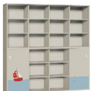
Szafa 4 + Regał 4