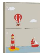
Szafa 2 + Szafa 2