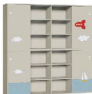
Szafa 4 + Szafa 4