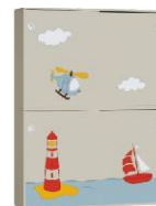
Szafa 2 + Szafa 2