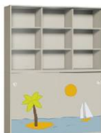
Szafa 2 + Regał 3