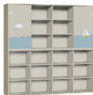
Regał 4 + Szafa 4