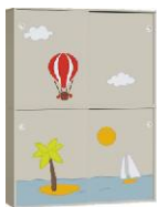
Szafa 2 + Szafa 2