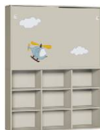
Szafa 3 + Szafa 2