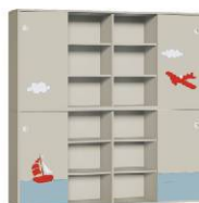
Szafa 4 + Szafa 4