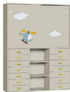
Komoda R1 + Szafa 2