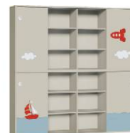
Szafa 4 + Szafa 4