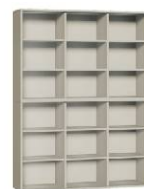
Regał 3 + Regał 3