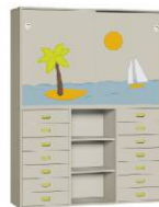
Komoda R1 + Szafa 2