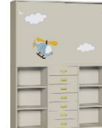
Komoda 7 + Szafa 2