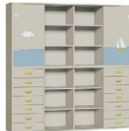
Komoda R4 + Szafa 4