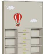
Komoda 7 + Szafa 2