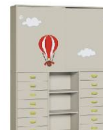
Komoda R1 + Szafa 2