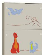
Szafa 2 + Szafa 2