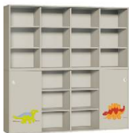
Szafa 4 + Regał 4