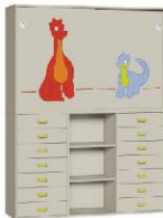
Komoda R1 + Szafa 2