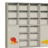
Szafa 4 + Regał 4