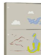
Szafa 2 + Szafa 2