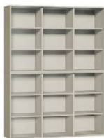
Regał 3 + Regał 3