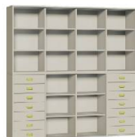
Komoda R4 + Regał 4