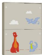
Szafa 2 + Szafa 2