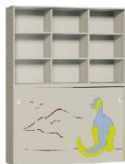
Szafa 2 + Regał 3