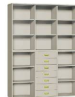
Komoda 7 + Regał 3