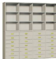
Komoda 28 + Regał 4