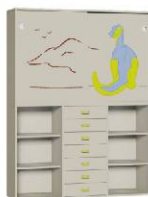
Komoda 7 + Szafa 2