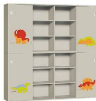
Szafa 4 + Szafa 4