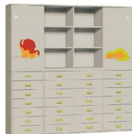
Komoda 28 + Szafa 4