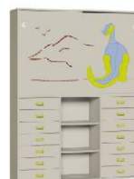
Komoda R1 + Szafa 2