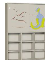
Szafa 3 + Szafa 2