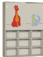
Regał 3 + Szafa 2