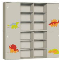
Szafa 4 + Szafa 4