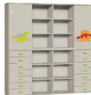
Komoda R4 + Szafa 4