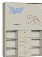
Komoda 7 + Szafa 2