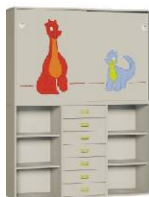
Komoda 7 + Szafa 2