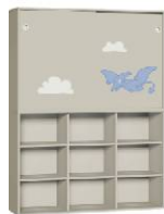
Regał 3 + Szafa 2