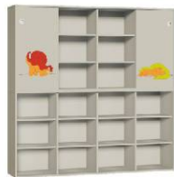
Regał 4 + Szafa 4