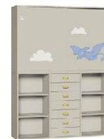
Komoda 7 + Szafa 2