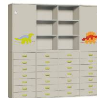
Komoda 28 + Szafa 4