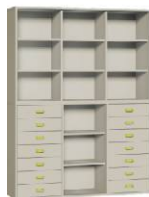
Komoda R1 + Regał 3