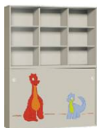
Szafa 2 + Regał 3