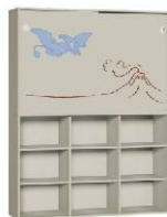
Regał 3 + Szafa 2