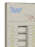
Komoda R1 + Szafa 2