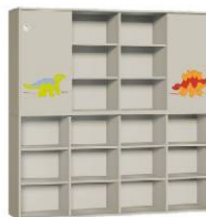
Regał 4 + Szafa 4