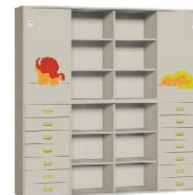
Komoda R4 + Szafa 4