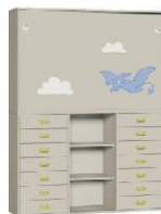
Komoda R1 + Szafa 2